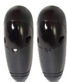
Jeu de photocellules RF37