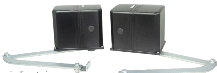
Coppia di motori con Centrale e ricevitore integrato