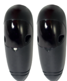
Coppia di fotocellule RF37